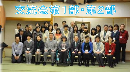
交流会第1部・第2部

診療所の設立当初から地域と二人三脚で地域医療に取り組み、時代とともに変化する医療・福祉のニーズに対応してこられたことはとても意義深いことだと思いました。また、地域に根差しながら最新の医療を学ぶ努力を怠らない姿勢にも感銘を受けました。〈医学科 4年(自治医)〉