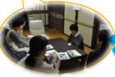
学生の感想文より

最初の研修旅行では滋賀県の保健医療圏など分からないことだらけでしたが、参加回数を重ねるごとに滋賀県が抱える地域ごとの問題点、病院ごとの医療連携など、滋賀県の医療体制が理解できるようになりました。〈医学科 3年〉