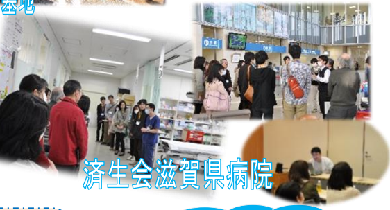
済生会滋賀県病院

大きな病院を見学させていただくのは初めてだったので、実感が湧くと同時に、救急や病理検査の現状について、先生方のお話を伺いすることで、それらの重要性を認識することができました。〈医学科 2年〉